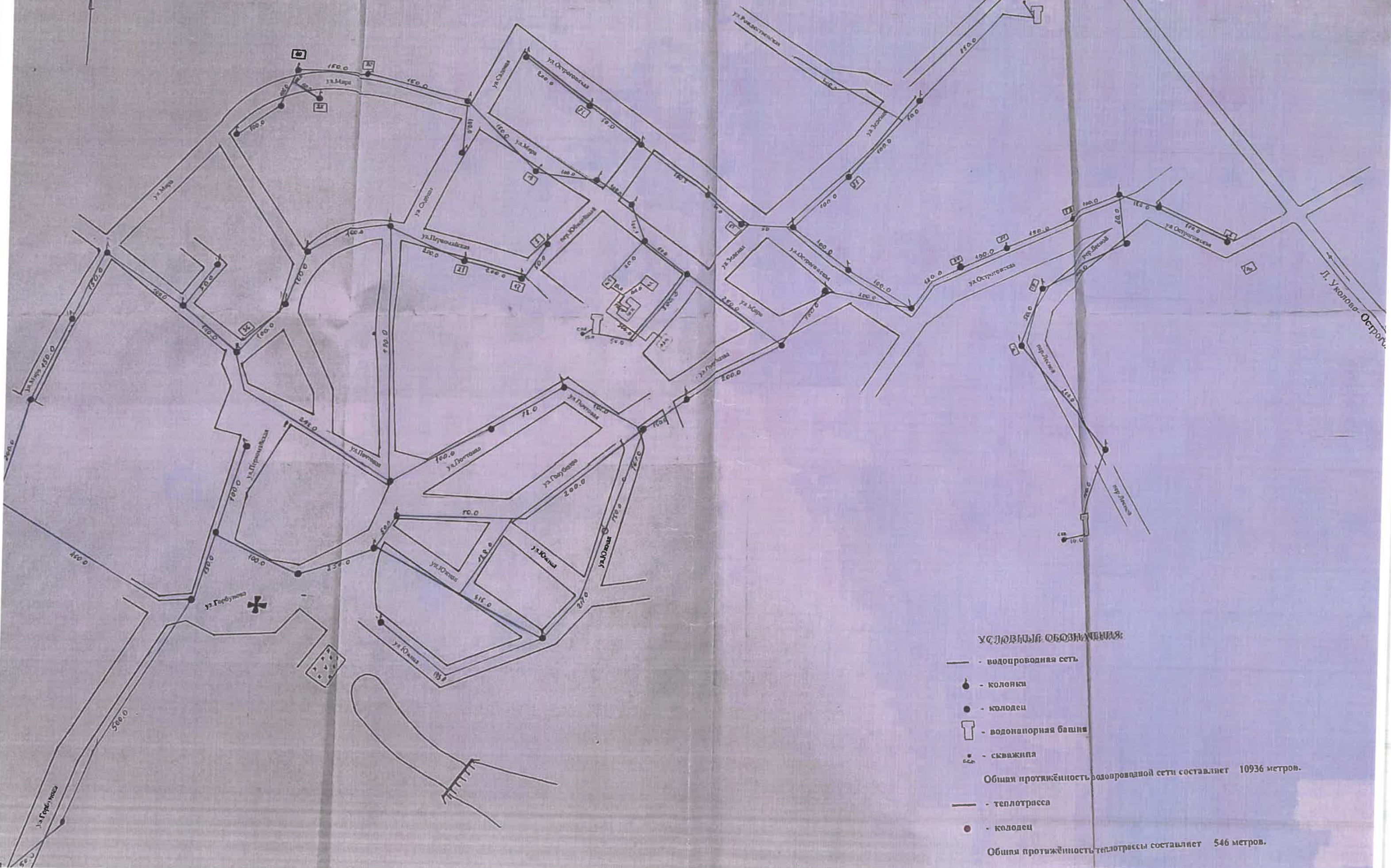
СХЕМА ТЕПЛО И ВОДОСНАБЖЕНИЯ село Шубино Шубинское сельское поселение Острогожский муниципальный район Воронежская область